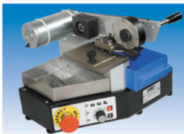
SEP4 code 109.0001-110 V SEP4 code 109.0002-220 V