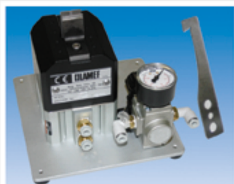
SEP3 code 106.0000 without blades

Compressed air pressure = 6 bar Weight = Kg. 2